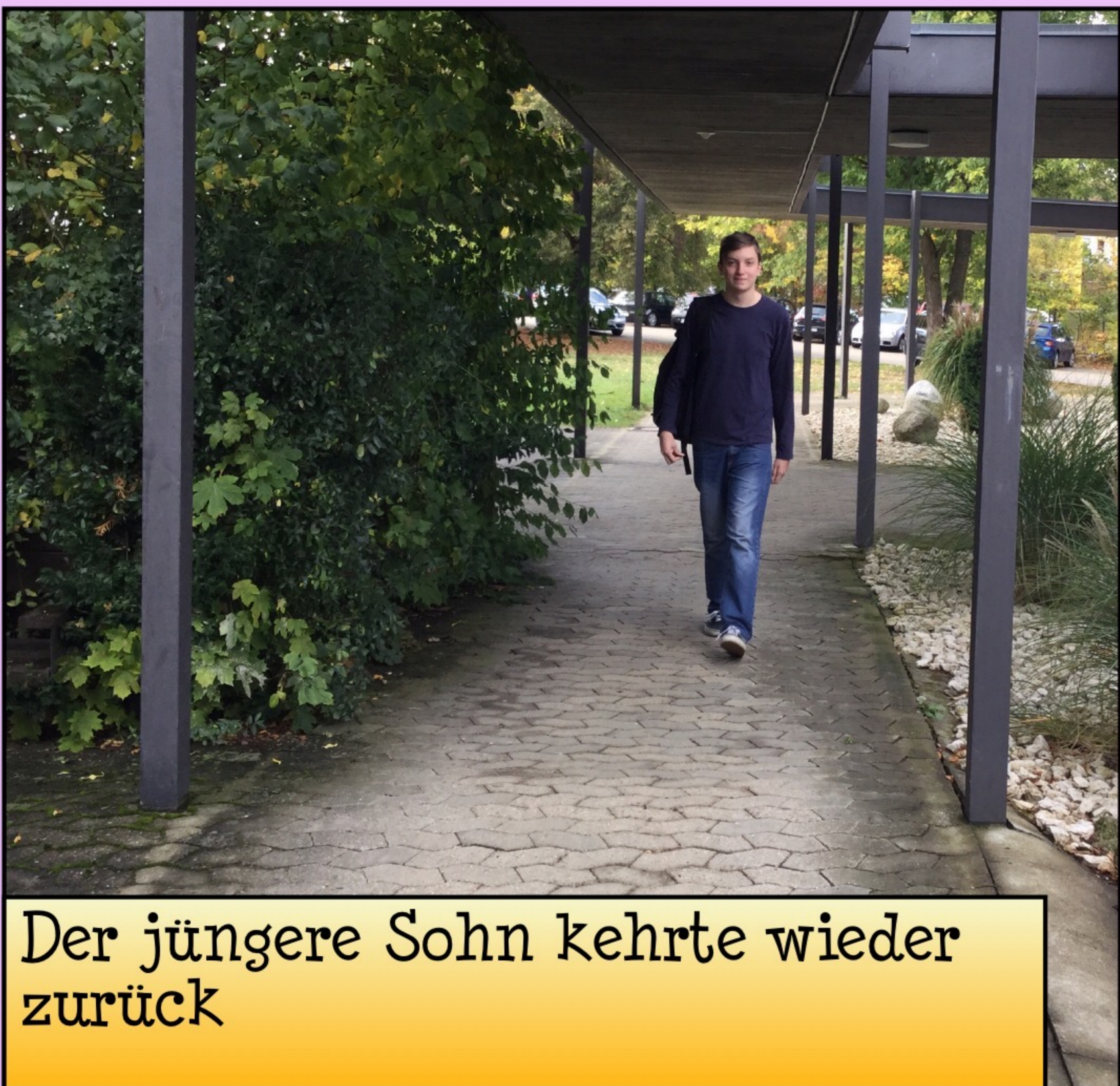
Der jüngere Sohn kehrte wieder zurück