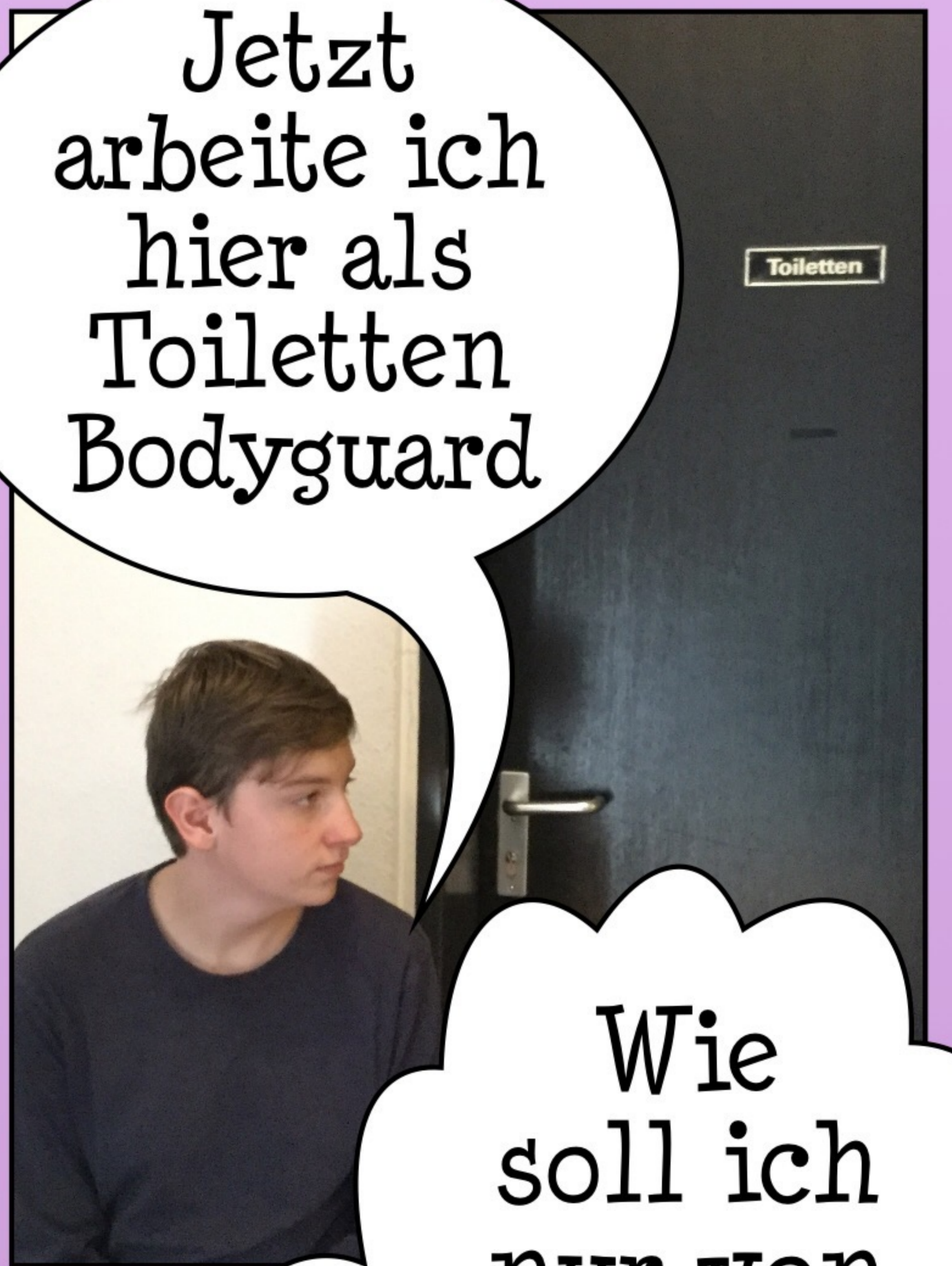
Und verspielte es...

Jetzt arbeite ich hier als Toiletten Bodyguard