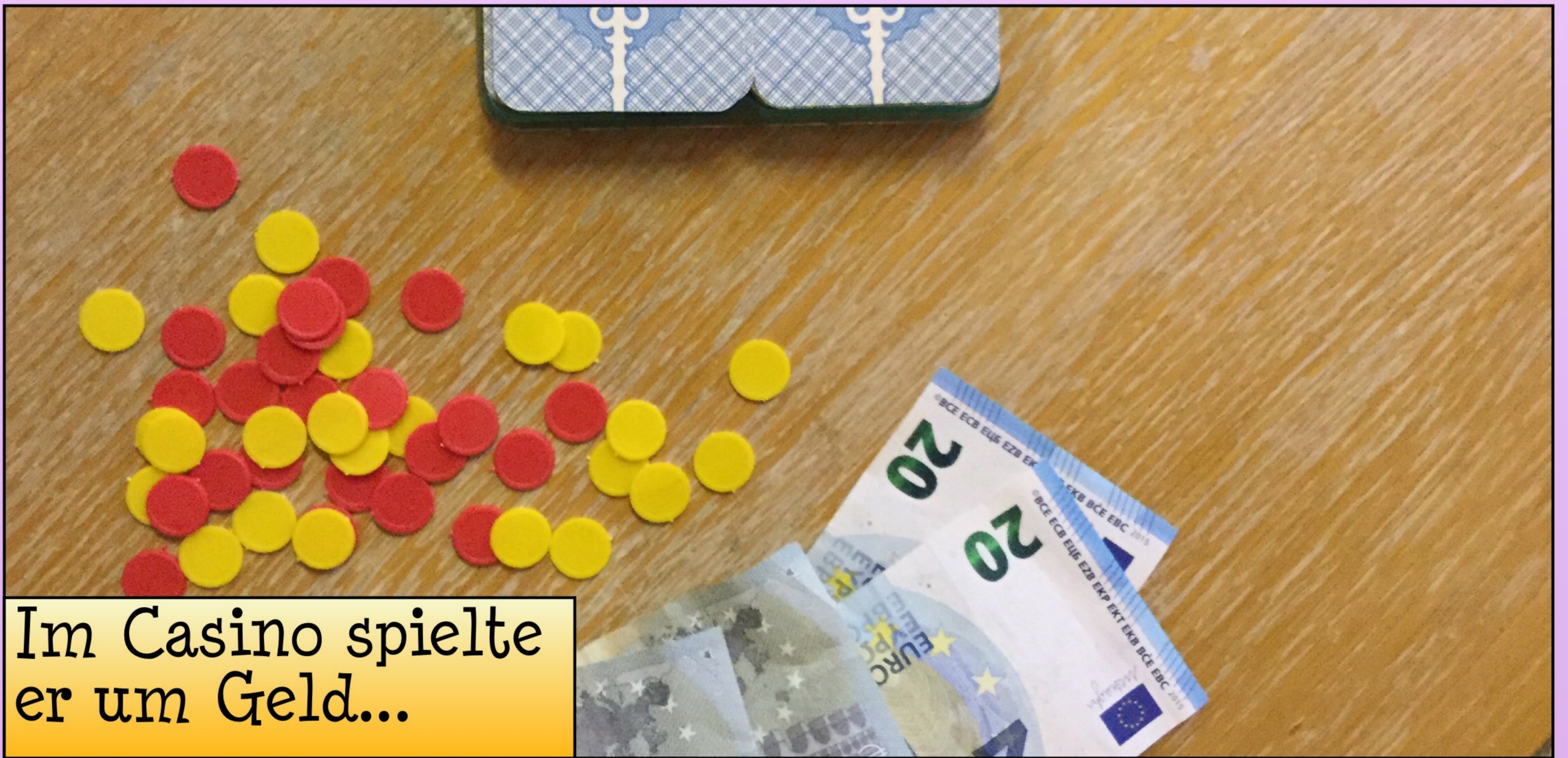
Im Casino spielte er um Geld...