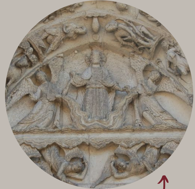
Chartres West Portal