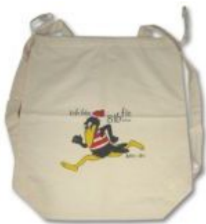
Kinderrucksack aus Baumwolle