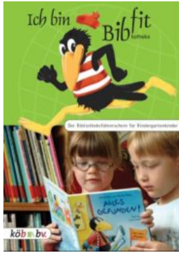
Plakat und Titelcover der Arbeitshilfe